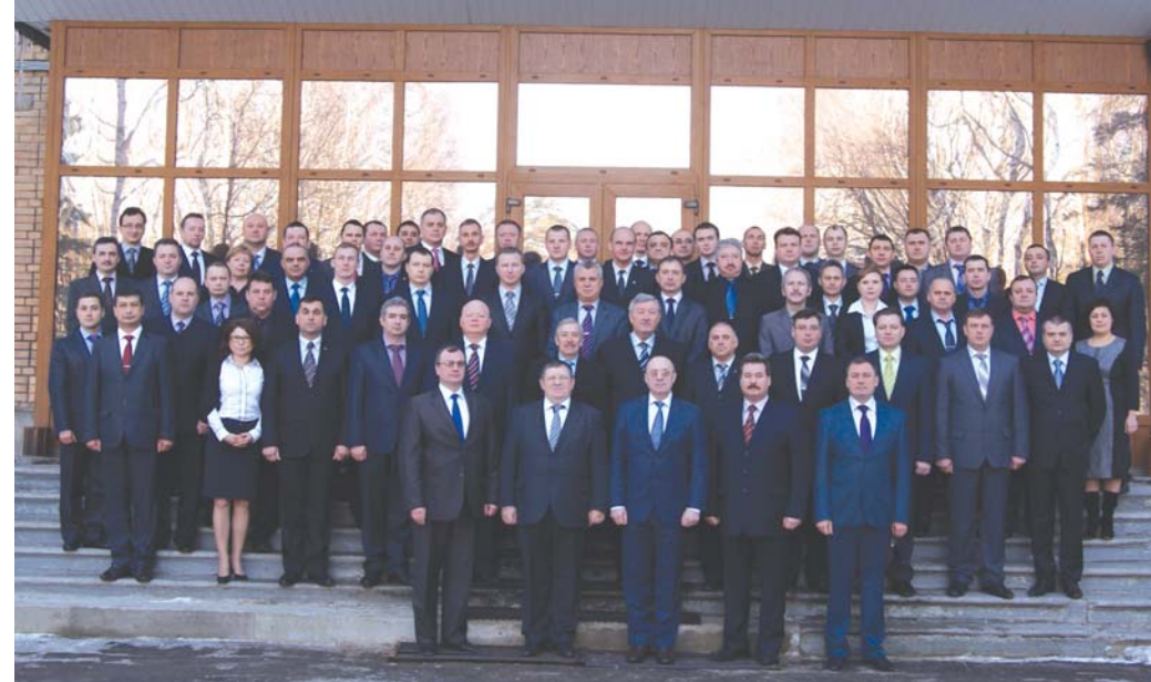
Сборы судей 3 окружного военного суда и подведомственных гарнизонных военных судов (февраль 2013 г.)

делами в отношении военнослужащих, но и всеми гражданскими делами, если те касаются правоотношений, возникших в местах дислокации особо режимных воинских объектов и формирований.