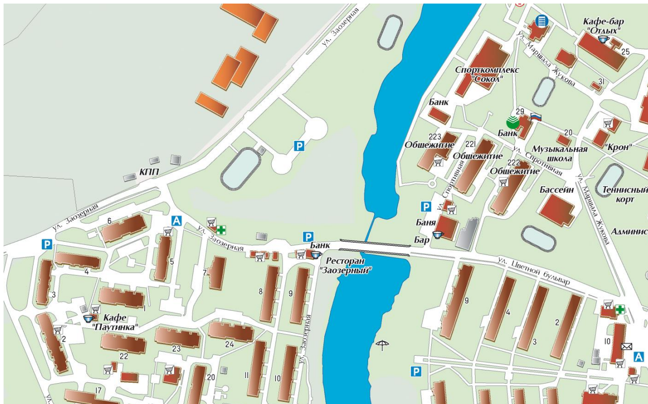
СХЕМА ИЗБИРАТЕЛЬНОГО УЧАСТКА